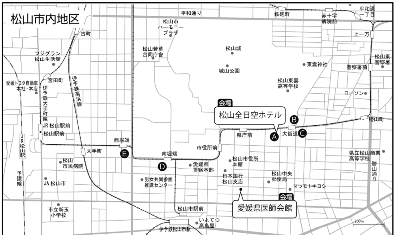
A : 松山全日空ホテル B : 松山東急REI C : カンデオホテルズ松山 D : 東京第一ホテル松山 E : ホテルJALシティ松山